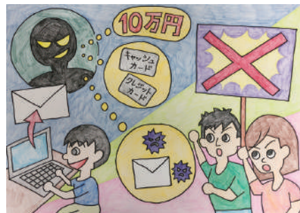
「安全なインターネット社会の実現 ～ SNS、メールの安全な利用～」部門