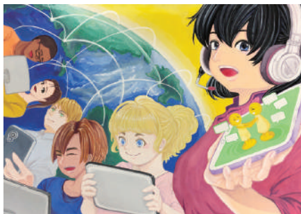
「安全なインターネット社会の実現 ～ SNS、メールの安全な利用～」部門