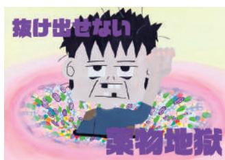
川西響さんの作品