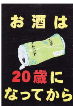
内山菜さんの作品