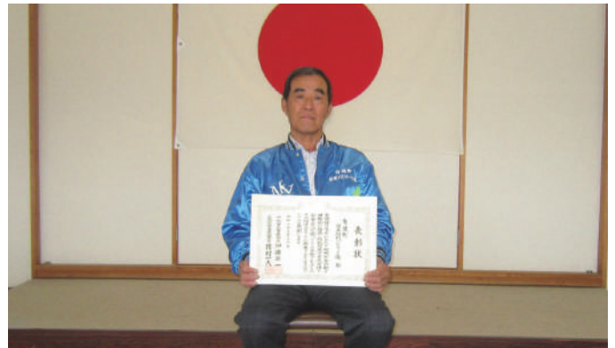
◎中部防犯協会連絡協議会会長表彰