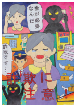
伊豆望来さんの作品