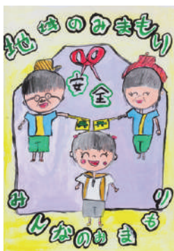
西浦蘭さんの作品

夏休み期間中に伊勢市内と度会郡3町の小中学生から募集した「地域安全ポスター」の審査会が行われ、その中から入賞者が決まりました。今年度も沢山のご応募を頂き、ありがとうございました。以下是最優秀賞作品と入賞者の一覧です。