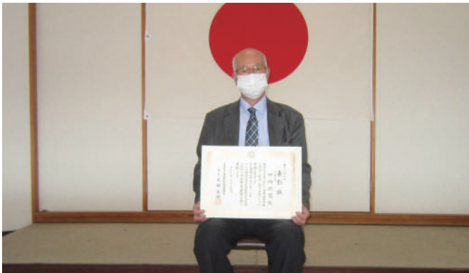
◎警察庁長官・全国防犯協会連合会会長表彰

令和2年度は、新型コロナウイルス感染症の影響により、地域安全・暴力追放三重県大会、三重県防犯協会連合会定期総会の開催が全て中止となり、表彰式が執り行われない状況となったことから、令和2年度の各表彰受賞者についてご紹介いたします。