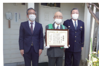
新 武則 氏