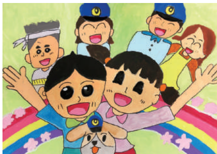
「子供・女性の犯罪被害防止」部門